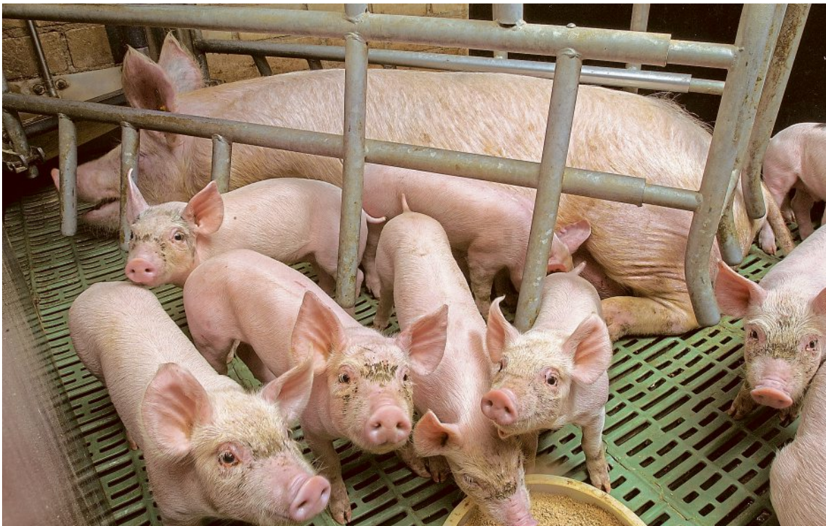
Welchen positiven, aber auch negativen Einfluss die Sauenmilch auf die Saugferkel hat, ist nur eins der Themen bei der Informationsveranstaltung für Schweinehalter und andere Interessierte in Schüttorf.

sich negativ auf die Tiergesundheit und das Leistungsvermögen der Schweine auswirken. Die beiden Fachleute Lemans und Brügger berichten von Beratungsfällen aus ihrer täglichen Praxis und geben Anregungen zur Verbesserung.