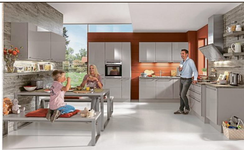
Die orange Wand zieht die Blicke auf sich und sorgt für eine beschwingte Atmosphäre.

Bereiche betont werden und wohin die Blicke gleiten sollen. Durch die Auswahl und Anordnung der Küchenmöbel und ihrer Farben kann beispielsweise eine entspannende und naturnahe Wohlfühlatmosphäre in der Küche erzeugt werden oder ein Gefühl von Weite und Transparenz. Mancher Küchenbesitzer möchte auch, dass seine Küche als klar abgegrenzter Rückzugsort gestaltet wird. Aufmerksamkeitssteigernd und dynamisierend wirken alle Rottöne. Für sommerliche Gefühle und eine offene, beschwingte Küchenatmosphäre sorgen Orange und Sonnengelb. Sollen Natürlichkeit, Frische und Beständigkeit betont werden, sind Grüntöne eine gute Wahl. Mit zarten Blau- und hellen Grautönen lassen sich kleinere Kü-