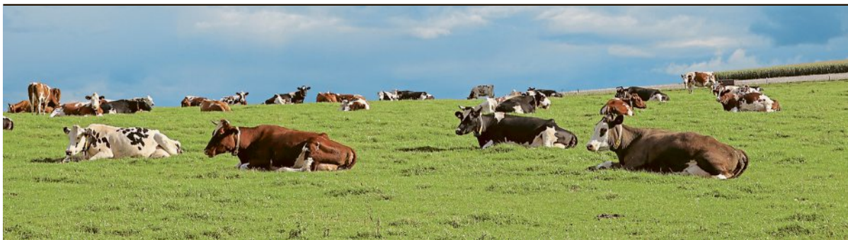
Prägend für die Milchviehherde auf dem Bierßenhof sind die Kreuzungskühe, die Milch- und Fleischleistung kombinieren.